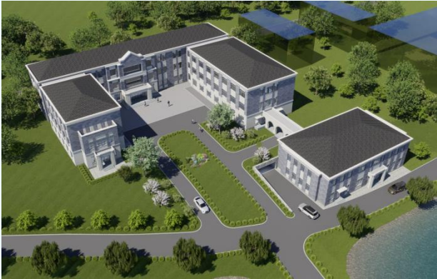
鸟瞰效果图 注：效果图仅为示意，具体立面材质以核准图为准。